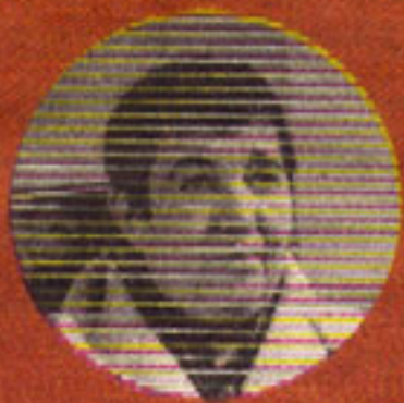
ANA MARÍA MOIX ESCRITORA