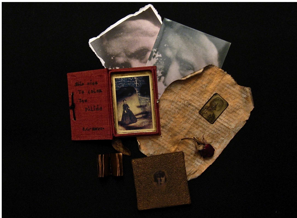
"Sólo oigo tu color tan pálido". 52 x 52 cm. Técnica mixta, collage. Año 2012

el próximo sábado día 16 de marzo de 2013 a las 12,30h.